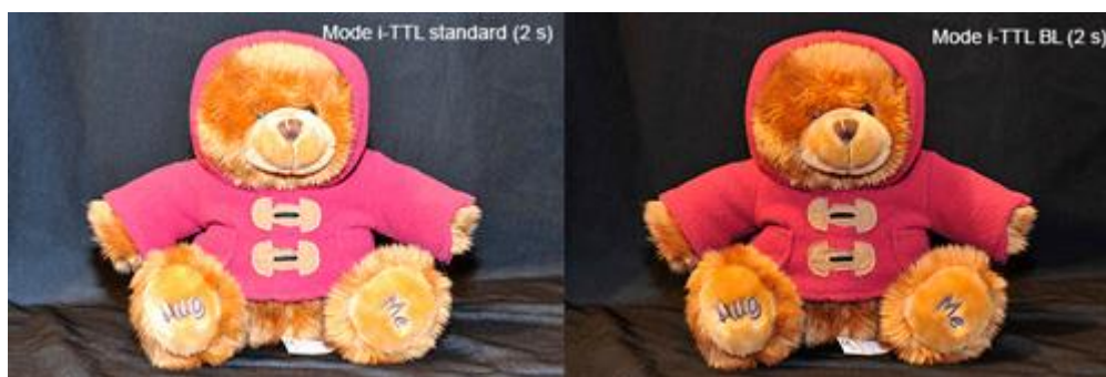
Ouverture f/8 – 200 ISO – distance du sujet 0,8m boîtier et flash en automatisme intégral

Les photos ci-dessous permettent de voir ce que donne l'équilibre flash/lumière ambiante avec un sujet 'sombre' :